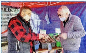
Les huîtres arrivent directement de Marennes.

A l'approche des fêtes, de nouveaux exposants participent au marché paysan.